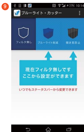
「ブルーライト・カッター」が使用できるようになります。