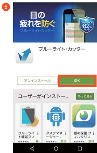
インストール後、「開く」をタップします。