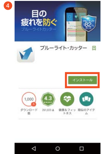
「インストール」をタップします。