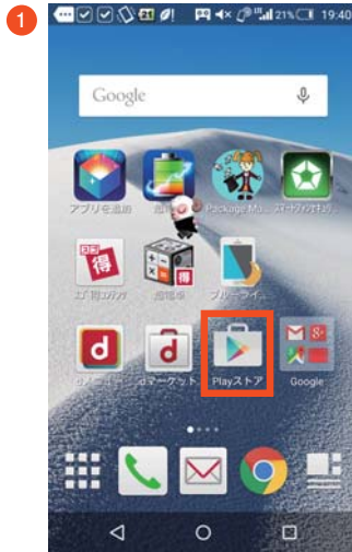
「playストア」をタップします。