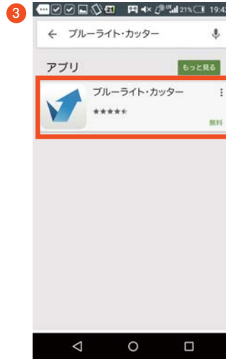
「ブルーライト・カッター」をタップします。