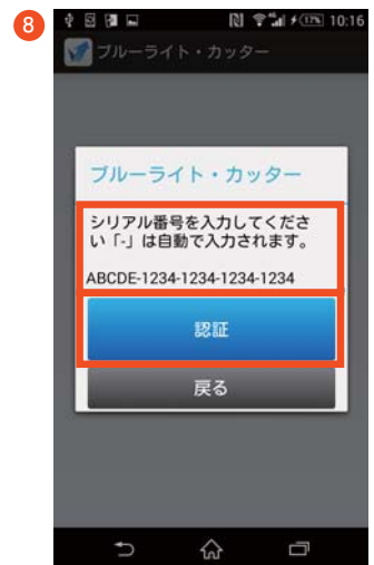
シリアル番号を入力し「認証」ボタンをタップします。