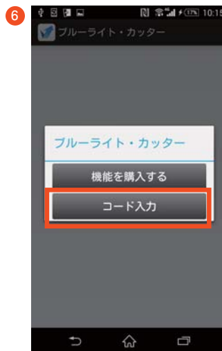
「コード入力」をタップします。